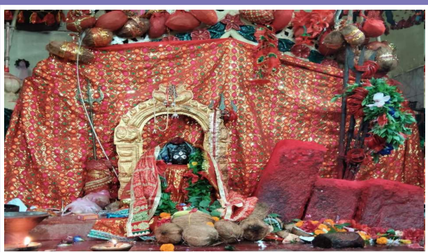
ଯା ଦେବୀ ସର୍ବଭୂତେଷୁ ଶକ୍ତିରୂପେଣ ସଂପୂର୍ଣ୍ଣା ନମଃତସ୍ୟେ ନମଃତସ୍ୟେ ନମଃତସ୍ୟେ ନମୋନମଃ ।