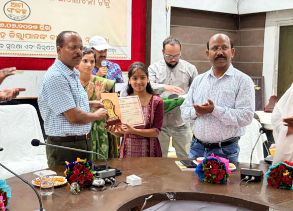
ଶପଥ ଗ୍ରହଣ କରି ନିଶାମୁକ୍ତ ସମାଜ ଗଠନ ପାଇଁ ପ୍ରଦାନ କରିଥିବା ବେଳେ ସୁଖ ଭାରତ ସଂଯୋଜକ